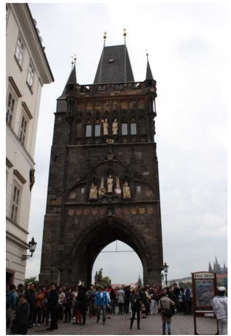
Après avoir traversé le pont St Georges (?), nous prenons le tram pour monter au château.